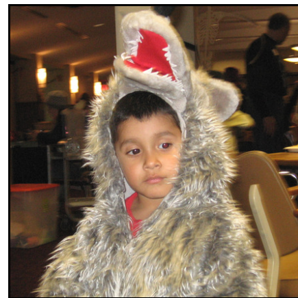
Nuestros niños con sus disfraces de Halloween en la noche familiar del año pasado.