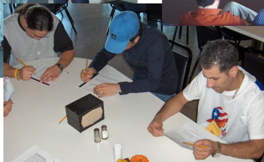
En retiros previos: Estudiando y pasándola bien